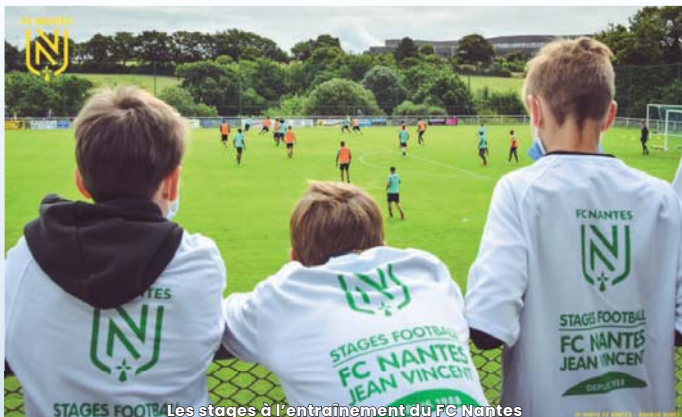
Les stages à l'entraînement du FC Nantes